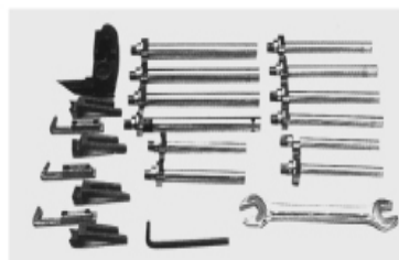
PILOTOS – HERRAMIENTAS DE CORTE