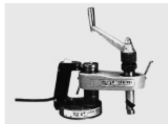
HUSILLO RECTIFICADOR CON BASE MAGNETICA